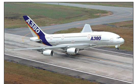
Airbus A380 au décollage