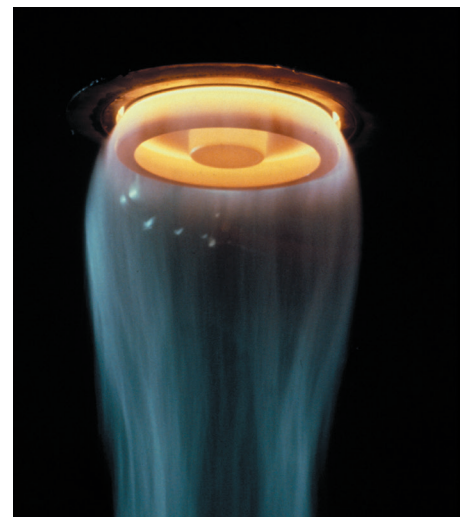
Assiette de fibrage